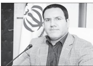
فرماندار اسلام‌شهر در نشست با پاک‌بانان سمنانی