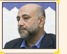
باید از مرحله قبض و درب منزل مراجعه کردن عبور کنیم.