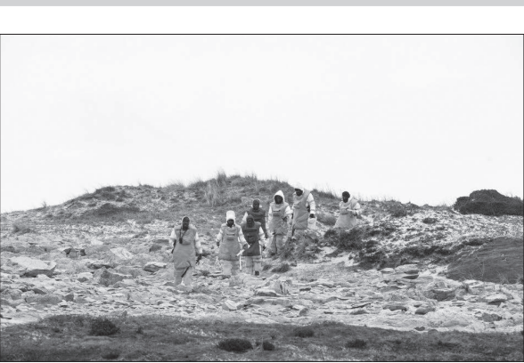
کارشناسان زیمبابوای طی یک دهه گذشته ۲۵ هزار، مین را که در سال ۱۹۸۲ توسط نیروهای آرژانتینی در فالکلند کار گذاشته شده بود را خنثی کرده‌اند.

در نتیجه باید به قالبیاب و حامیان او یک توصیه ساده کرد. برای ورود به انتخابات زیاد به نظر سنجی‌ها دل نبندید و فکری به حال استراتژی‌های انتخاباتی خود کنید.