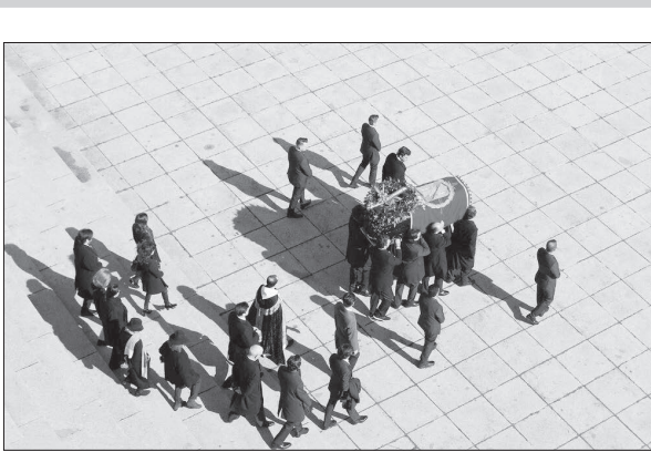
بقایای جسد ژنرال فرانکو، دیکتاتور سابق اسپانیا ۴۴ سال پس از مرگش از آرامگاه فعلی خود به یک گور خانوادگی در حومه مادرید انتقال یافت.