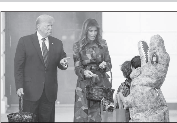
ترامپ و همسرش در حال شکلات دادن به بچه‌ها در جشن «هالوین» در کاخ سفید