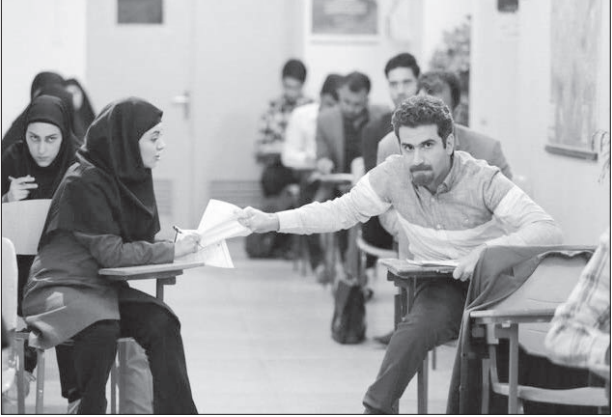
عکس‌نمایش آسرایان در سینما