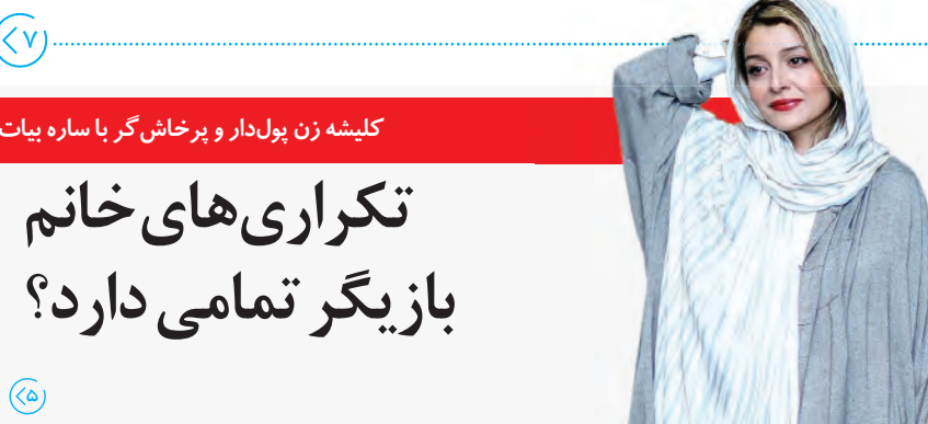
کلیشه زن پول‌دار و پر خاش‌گر با ساره بیات