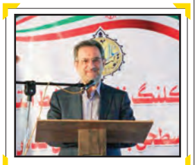
به عنوان استاندار تهران به مردم شهرستان قدس قول می‌دهم که هر آنچه توان داشته باشیم برای تسریع در بهره‌برداری مردم از آب شرب این طرح به کار گیریم

تا پیگیر مطالبات مردم شریف استان باشیم گفت: مطالبه‌گری که خواهیم داشت شاهد افتتاح طرح‌های درمانی و آموزشی خوبی در غرب استان خواهیم بود و به عنوان استاندار تهران به مردم شهرستان قدس قول می‌دهم که هر آنچه توان داشته باشیم برای تسریع در شرب سالم برخوردار خواهد کرد.