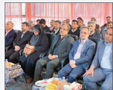
قدس / گروه استان‌ها aaramm69@gmail.com