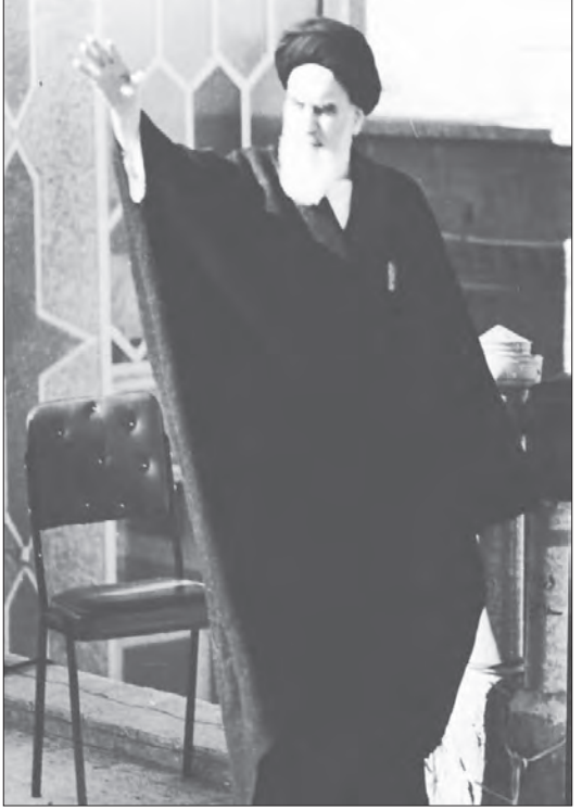
صفحه اینستاگرام رهبر انقلاب به مناسبت رحلت امام خمینی، عکسی کمتر دیده شده از ایشان را منتشر کرد.