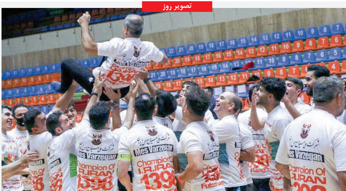
تصویر روز جشن های قهرمانی بی پروتکل؛ تیم مس سونگون ورزشکاران با برتری ۹ بر ۸ مقابل رقیب سنتی خود گیتی پسند اصفهان برای سومین بار بیای قهرمان لیگ برتر فوتبال باشگاه های کشور شد.

ضرورت رعایت نکات بهداشتی، فاصله گذاری اجتماعی و استفاده از ماسک در اماکن عمومی برای عبور از دوران سخت کرونا، سوژه کارتون از علیرضا پاکدل در صفحه اینستاگرامی اش شد.