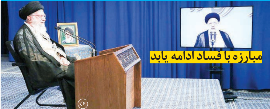
مبارزه با فساد ادامه یابد