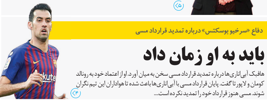
دفاع «سرخو بوکتس» درباره تمدید قرارداد مسی