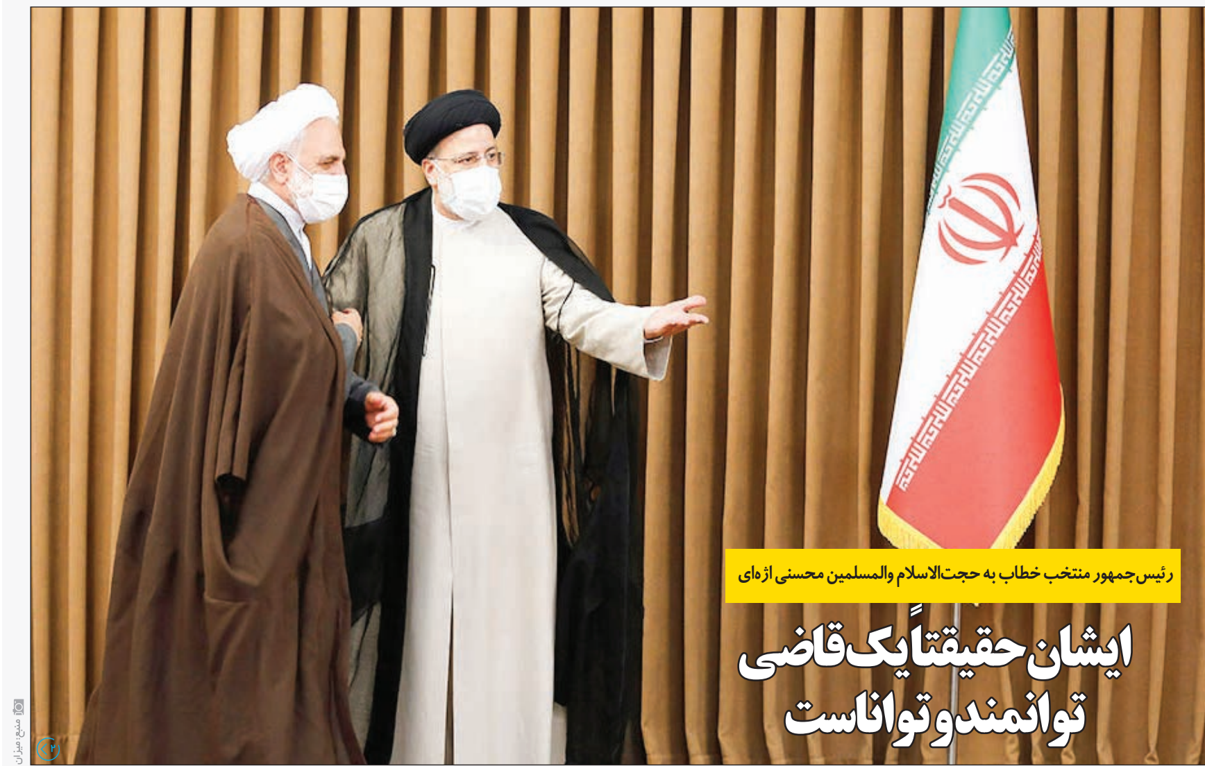
رئیس جمهور منتخب خطاب به حجت الاسلام والمسلمین محسنی اژه‌ای