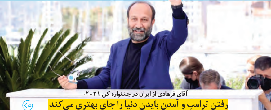
آقای فرهادی از ایران در جشنواره کن ۲۰۲۱ رفتن ترامپ و آمدن بایدن دنیا را جای بهتری می‌کند