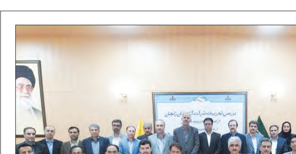
مدیر عامل شرکت ملی گاز استان زنجان خبر داد: برگزاری بیش از ۱۸ هزار نفر ساعت دوره آموزش مجازی برای کارکنان

دوره آموزشی بازرسی فنی جوش خطوط لوله با حضور رئیس بازرسی فنی خط انتقال گاز ایران و برگزاری دوره آموزشی امداد کمک‌های اولیه با حضور کارشناسان مجرب هلال احمر استان به صورت کارگاه عملی از دیگر اقدامات واحد آموزش گاز زنجان بوده است. احمدلو افزود: آموزش با کیفیت، مؤثر و کارآمد از دغدغه‌های همیشگی گاز زنجان در تأمین نیاز آموزشی کارکنان در راستای رسیدن به اهداف سازمانی است.