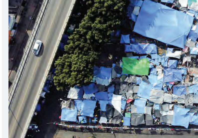
کمپ پناهجویان عازم مرز ایالات متحده آمریکا در مکزیک.