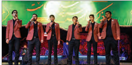
موضوعات مذهبی، دینی و اجتماعی در سطح شهر و کشور و حتی در سطح بین‌المللی از شبکه‌های مختلف در حال پخش است.

«هنرمندان» اظهار داشت: چنین برنامه‌هایی باید در سطح شهر به خصوص در مناسبت‌ها برگزار شود و اطلاع‌رسانی بیشتری صورت گیرد تا شهروندان از این برنامه مطلع شده و در آن شرکت کنند. وی درباره تاریخچه فعالیت گروه سرود و هم‌خوانی آوای مهر طاهای افزود: فعالیت گروه سرود و هم‌خوانی آوای مهر طاهای، از سال ۱۳۸۲ آغاز شده است و سرود و نماهنگ‌های ما با موضوعات مختلفی همچون