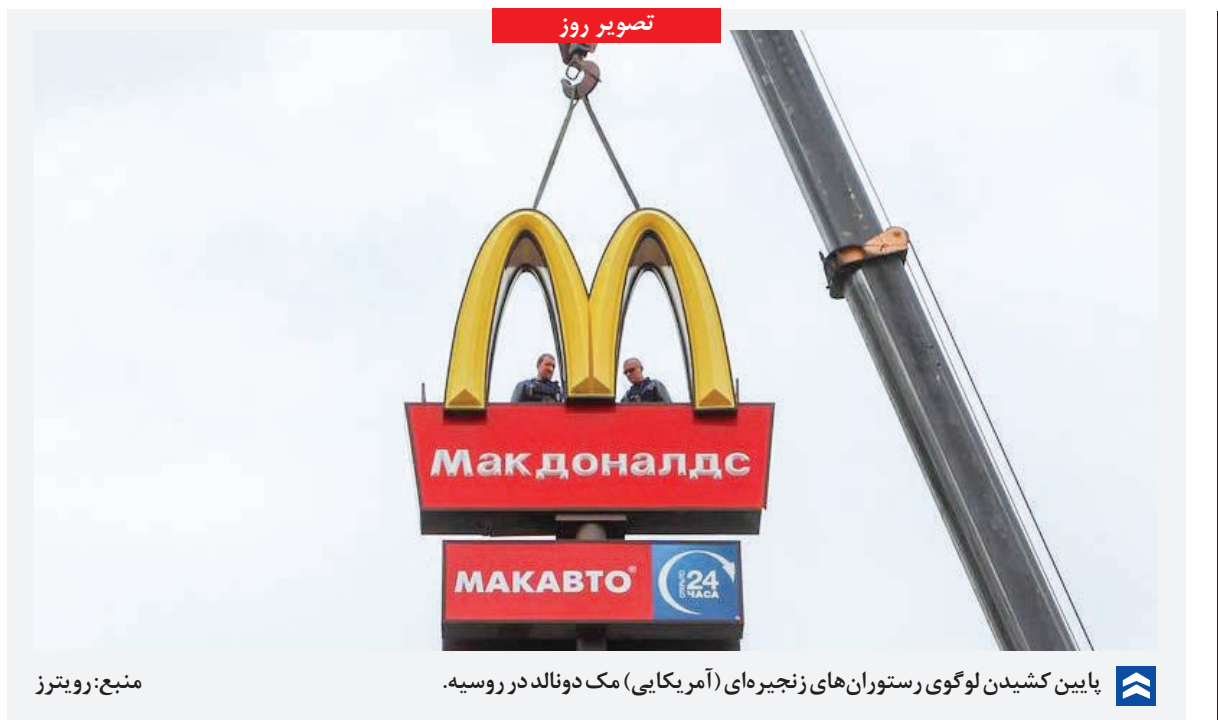
پایین کشیدن لوگوی رستوران های زنجیره ای (آمریکایی) مک دونالد در روسیه.