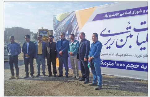
نوشیروان اسلامی / گروه استان‌ها

مسئول روابط عمومی منطقه سازی با اشاره به اینکه امروز دشمن با جنگ نرم به میدان مبارزه آمده و ما باید ارزشهای اسلام و انقلاب را بیش از پیش در جامعه، نسل جوان و فضای آرای گسترش دهیم، افزود: امروز مسئله نماز و امر به معروف و نهی از منکر که عسل اصلی قیام امام حسین (ع) بوده است باید به صورت جدی و پرنرنگ‌تر از گذشته در میان احاد جامعه مخصوصاً نسل جوان دنبال شود.