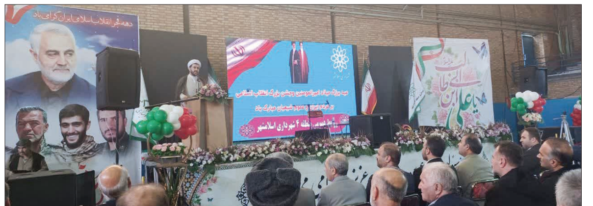
برگزاری جشن میلاد حضرت علی (ع) و چهل و چهارمین سالگرد پیروزی انقلاب اسلامی ایران