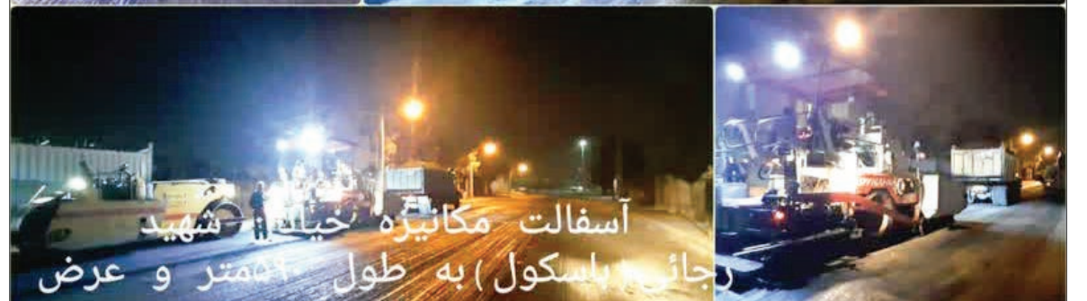
آسفالت مکانیزه خیابان شهید رحیمی جایی به طول ۵۹۰ متر و عرض ۱۳ متر