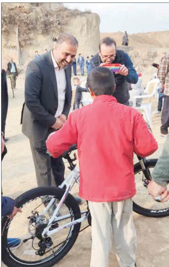
برگزاری جشن شب پلدادر میان کودکان کار کوره پزخانه‌های شمس آباد

مهم‌ترین مطالبات شهروندان از مجموعه مدیریت شهری است و این نکته نیز بر کسی پوشیده نیست که راهکارهای پیشنهادی