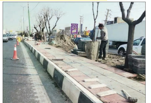
نصب کفیوش ۷ سانتی با مقاومت بالا در بزرگراه آیت‌اله سعیدی