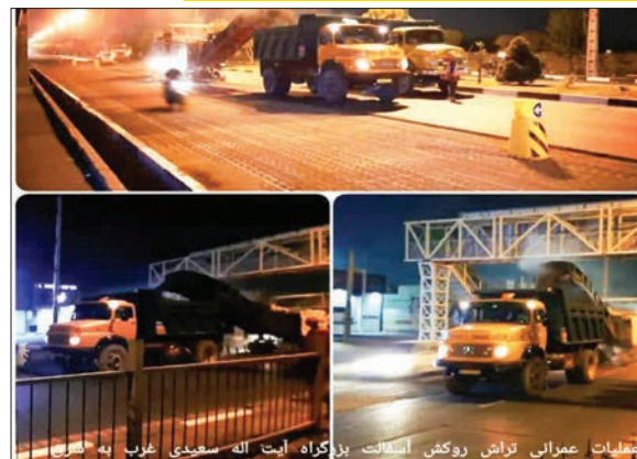
عملیات عمرانی تراش و روکش آسفالت بزرگراه آیت‌اله سعیدی غرب به شرق