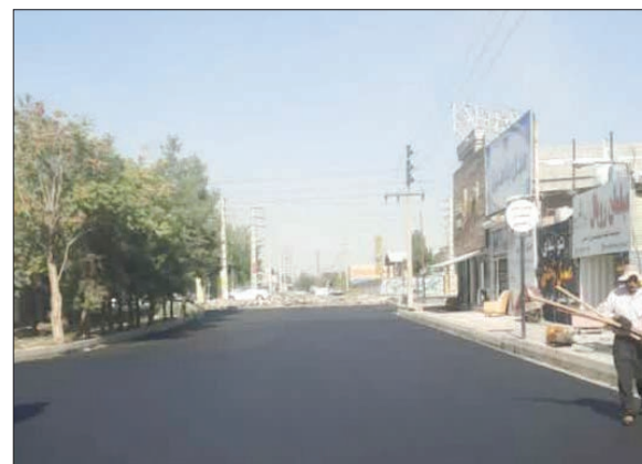
اجرای پروژه آسفالت مکانیزه و بازگشایی معابر