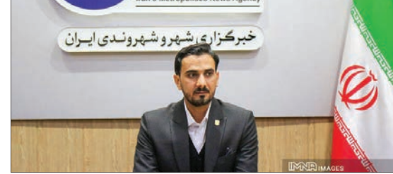
نسل فردا / گروه ایران news@nasle-farda.net