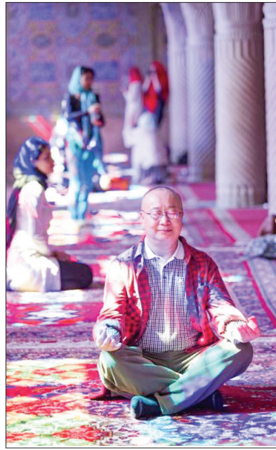
توره‌های ایران در سیاست «کرونا سفر» یک روزه توسط چینی‌ها خریداری شد؛