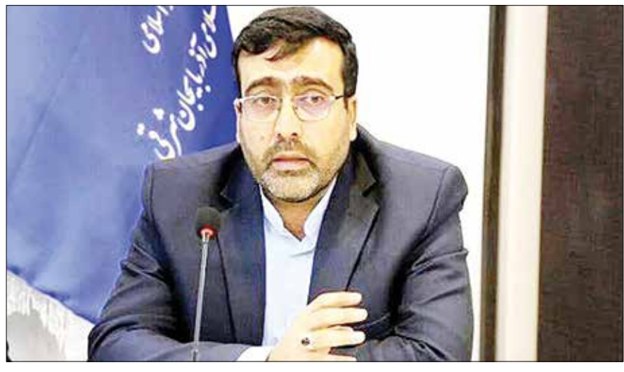
تبریز