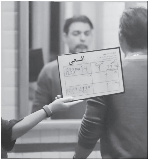
سکانس از فیلم

توضیح این نکته مایه تعجب عوامل سازنده «افعی تهران» شده که شخصیت ناظم مدرسه در این سریال به عنوان یک شخصیت ساختگی به هیچ‌وجه پرچ‌دار تمام شاغلین نظام آموزشی کشور نیست. همان‌طور که شخصیت اصلی سریال به عنوان یک منتقد و وا‌احدهای حقوقی تابعه در سراسر کشور نیز معاضدت قضایی از جامعه یک میلیون ی فرهنگیان است، اعلام کرد: در جهت برخورد با این اقدام ناشایست و غیراخلاقی نویسنده و اعلام کارگردان و عوامل سریال یاد شده، شکایت و اعلام جرم رسمی وزارت آموزش و پرورش به دادستان عمومی و انقلاب ارائه و توقف پخش سریال مورد اشاره و برخورد قانونی لازم تقاضا شده است.به گزارش ایستنا، پیمان معادی –فیلمنامه نویس و بازیگر اصلی سریال «افعی تهران»- اخیراً با انتشار تصاویری از دوران مدرسه و معلم قدیمی خود در صفحه‌ی شخصی‌اش، درباره این سکانس حاشیه‌ساز نوشت: «بازنشر سکانس‌های شاخص سریال افعی تهران باعث بحث و تبادل نظر میان مخاطبین سریال و کاربران شبکه‌های اجتماعی شده است.در این بین مواجعه شخصیت اصلی داستان با ناظم مدرسه‌ای که سابقه تنبیه بدنی دانش‌آموزان را داشته بیش از همه مورد تحلیل قرار گرفته است.»او در ادامه آورده است: «لژوم