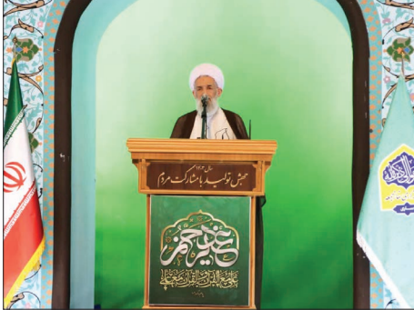
آیت الله محمدی لائینی

نماینده ولی قبیله در مازندران یادآور شد: رئیس جمهور شهید در سفر آخر به مازندران فرمودند که ۱۰ نفر از مدیران باید تعویض شوند علتش قطعاً ناکارآمدی است، اصلاً چرا منصوب شدند؟ شاید اگر خوب بررسی می شد تعداد از این هم بیشتر بود، البته اینها باعث نمی شود که ما مدیران و کارکنان خوب و لایق را نبینیم چرا که پاکدست ها زیاد هستند.