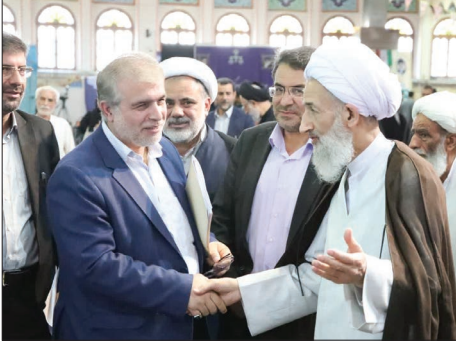
آیت الله محمدی لائینی

آیت الله محمدی لائینی ادامه داد: ما ۳ میلیون زوج با مشکلات ناباروری داریم که باید درمان شوند، اما درمان هر کدام حدود ۱۰۰ میلیون تومان هزینه دارد که ندارند، در گذشته برای کنترل جمعیت مجانی عقیم می کردند اما الان برای درمان نازایی هزینه نمی شود، در حوزه صنعت مشکل داریم، صنایع کشاورزی، تبدیلی، کوچک و بزرگ و دانش بنیان ها مشکل داریم که به نظر می رسد بخشی از این مشکلات معلول بی کفایتی و ترک فعل های مدیران است.