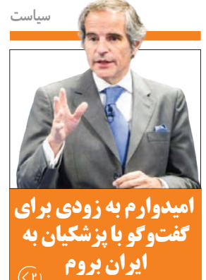
امیدوارم به زودی برای گفت و گو با پزشکین به ایران بروم