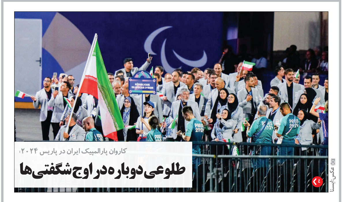
کاروان پارالمپیک ایران در پاریس ۲۰۲۴؛ طلوعی دوباره در اوج شگفتی ها