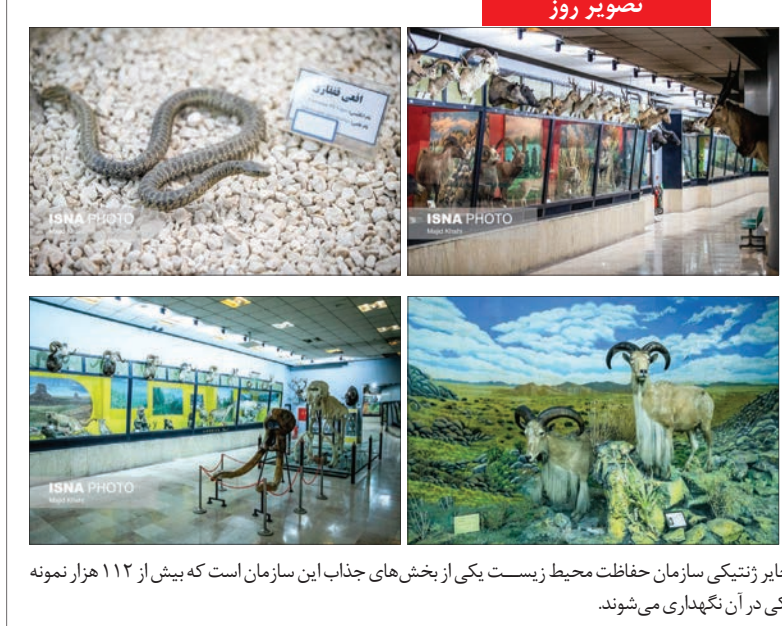
سفر به دنیای محیط زیست، موزه ملی تاریخ طبیعی و ذخایر ژنتیکی سازمان حفاظت محیط زیست یکی از بخش های جذاب این سازمان است که بیش از ۱۱۲ هزار نمونه گیاهی، جانوری، فسیل، سنگ و کانی، تاکسیدرمی و ژنتیکی در آن نگهداری می شوند.