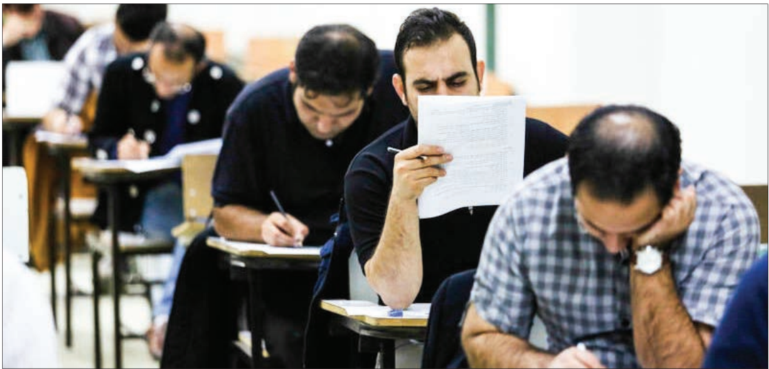
رئیس سازمان اداری استخدامی؛