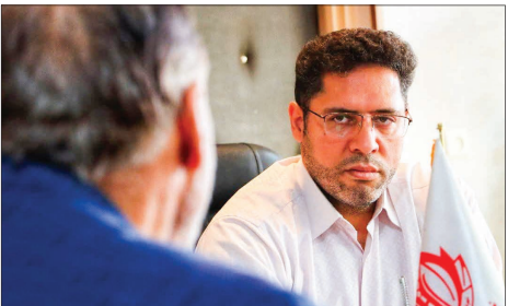
شهردار ماهدشت و معاونین از نزدیک با مردم دیدار و به مشکلات آنها رسیدگی کرد.

راضیه دارابی / گروه ایران news@nasle-farda.net