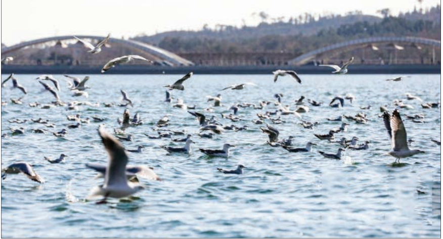
کوچ پرندگان مهاجر به دریاچه شهدای خلیج فارس