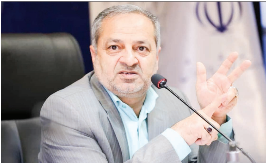
وزیر آموزش و پرورش؛