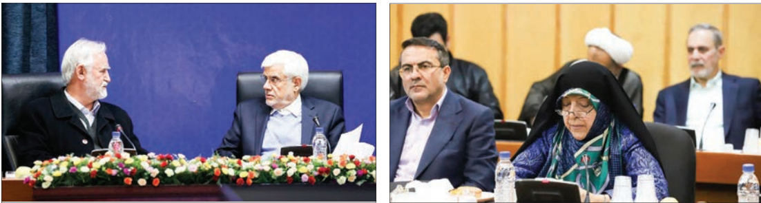
عارف دردورهمی با وزرای ادوار: