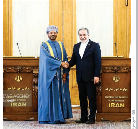
وزیر امور خارجه عمان در دیدار با مقامات ارشد ایران تاکید کرد،