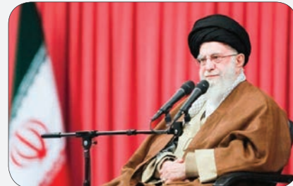
در سالروز قیام تاریخی مردم قم در ۱۹ دی ماه ۱۳۵۶ جمعی از اهالی شهر مقدس قم با ولی امر مسلمین امام خامنه‌ای دیدار

خواهند کرد. به رسم هرساله، امسال نیز در روز چهارشنبه ۱۹ دی ماه (امروز) مردم قهرمان و غیور شهر مقدس قم با ولی امر مسلمین امام خامنه‌ای دیدار و از فیض کلام معظم‌له بهره‌مند خواهند شد. این دیدار تجدید عهدی دوباره با آرمان‌های امام، شهدا و رهبر معظم انقلابی خواهد بود و بار دیگر نشان خواهد داد که مردم قم همچنان پرچم‌دار حمایت از انقلاب اسلامی و ارزش‌های والای آن هستند.