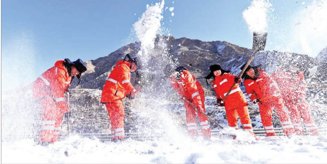
کارگران جاده برفی را پاک می کنند / اژنگیه، چین