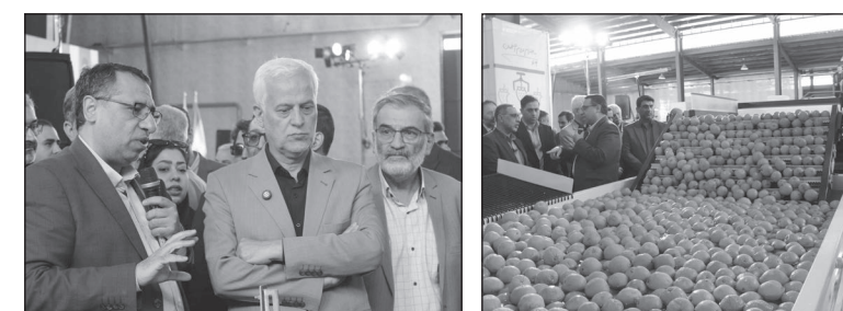
سخنگوی قوه قضایه:

مدیرعامل سازمان ساماندهی مشاغل شهری و فرآورده‌های کشاورزی شهرداری اصفهان نیز در آئین بهره‌برداری از پروژه‌های جدید سازمان ساماندهی مشاغل شهری و فرآورده‌های کشاورزی شهرداری اصفهان گفت: میدان میوه و تره‌بار اصفهان دومین میدان در کشور از لحاظ وسعت، حجم گردش و نقش توزیع میوه و تره‌بار در اصفهان فراهم شده است.