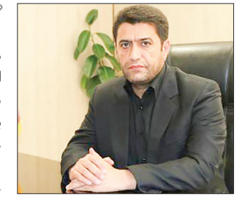
مرکزی نسل فردا

گذشته با ۵۳۹ هزار و ۸۸۹ سفر، ۲ درصد افزایش یافته است. وی ادامه داد: در این مدت، یک میلیون و ۳۳۱ هزار و ۹۲۴ مسافر توسط حمل و نقل عمومی استان مرکزی جابه‌جا شده که ۵۴ درصد این افراد معادل ۷۲۴ هزار ۴۶۷ نفر توسط سامانه حمل و نقل اتوبوسی، ۲۱ درصد معادل ۴۱۵ هزار و ۸۸۹ نفر توسط مینی‌بوس، ۱۵ درصد معادل ۱۹۱ هزار و ۵۶۸ مسافر توسط سامانه سواری استان جابه‌جا