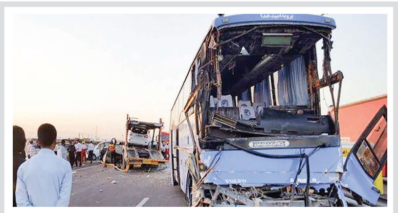
جزئیات واژگونی اتوبوس ولوو در اتوبان تهران - قم اعلام شد