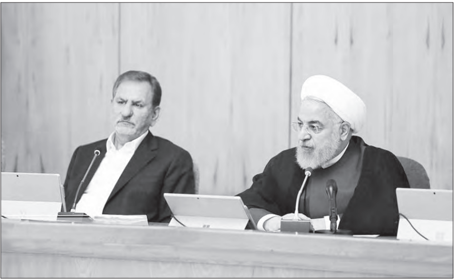
عادل عبدالمهدی، نخست‌وزیر عراق، در نشست با روحانی، رئیس‌جمهور ایران، در تهران، ۲۲ ژوئیه ۲۰۱۹.