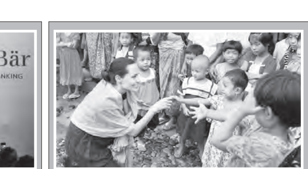
آنجلینا جولی و بحران آوارگان

آزاده سلیمان نژاد گروه فرهنگ و هنر news@nasleforda.net