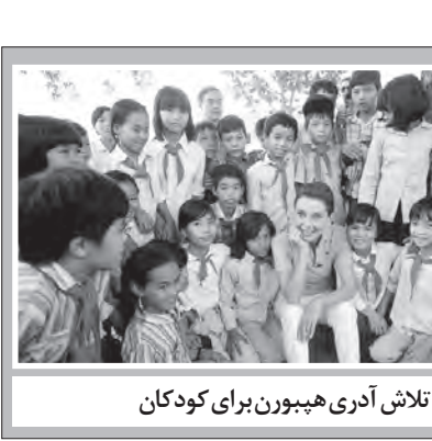
تلاش آدری هپیورن برای کودکان

دی‌کاپریو بازیگری که با فیلم «تایتانیک» شهرتی جهانی پیدا کرد و