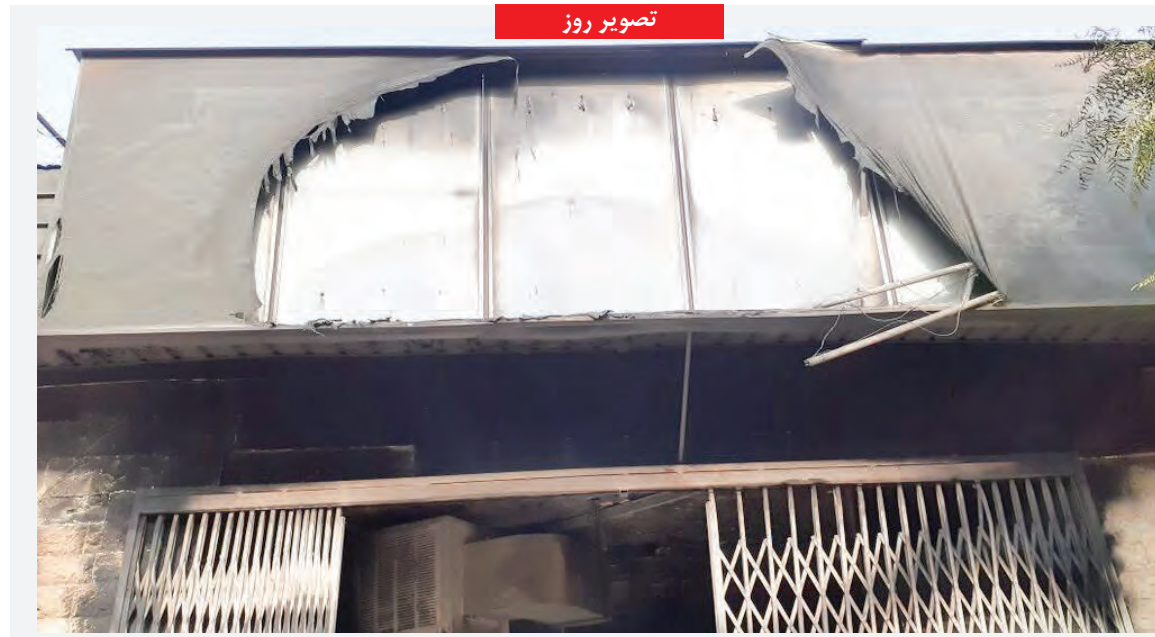
در جریان سوء استفاده عناصر آشوبگر از اعتراضات مردمی در شب شنبه، «کتابخانه تفکر» شهرستان شهریار به دست آشوبگران به آتش کشیده شد و حدود ۱۳۰۰۰ جلد کتاب در آتش جهل و کینه سوخت. خسارت وارده به این کتابخانه در حدود ۲۰ میلیارد ریال ارزیابی می شود.

این کاریکاتور را علیرضا ذاکری طی سال های ۲۰۰۳ تا ۲۰۱۹ طراحی کرده، نشان از آن دارد که رؤسای جمهور آمریکا همواره پیشنهاد مذاکره با ایران را قلدرا میانه مطرح کرده اند در حالی که برای جلب افکار عمومی و موفقیت در انتخابات، به شدت نیاز به ارتباط و مذاکره مستقیم با ایران دارند!