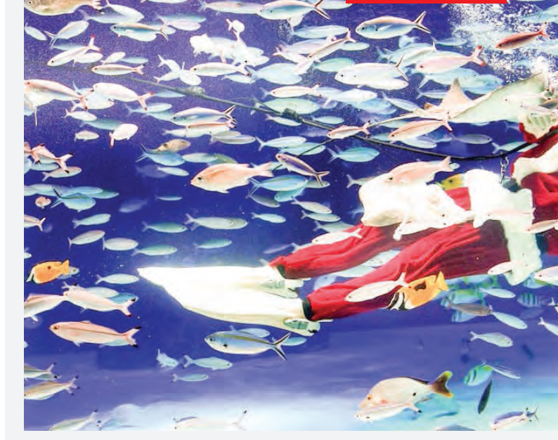
حال و هوای کر بسمسی آکوارיום توکیو