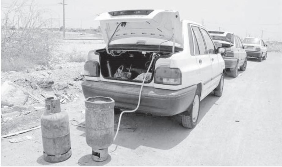
عکس از ویدئا

که اگر فرآیند استفاده غیر مجاز از ال پی جی به عنوان سوسخت خودروها ادامه یابد، متأسفانه به دلیل عدم رعایت الزامات ایمنی آمار حوادث در آینده به نحو چشمگیری افزایش خواهد یافت.