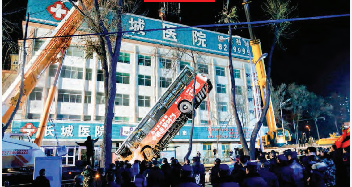
افتادن یک اتوبوس داخل گودالی در شهر «شینینگ» چین. در این حادثه ۶ مسافر کشته شدند.