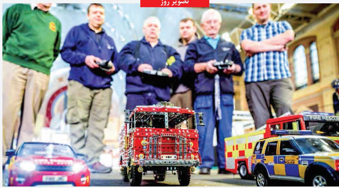
نمایشگاه مدل های مینیاتوری لندن در سال ۲۰۲۰، نزدیک به ۲۰۰۰ نمونه از موتورهای کششی تا کامیون های کنترل از راه دور را برای بازدید کنندگان به نمایش گذاشته است.