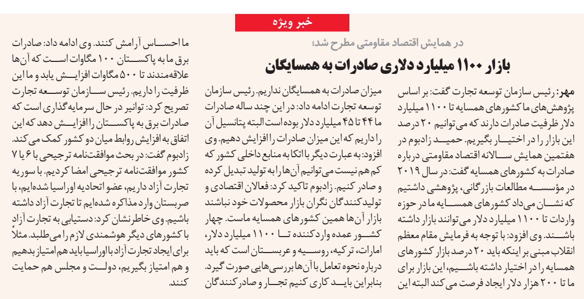
گزارش نخستین رئیس سازمان توسعه تجارت