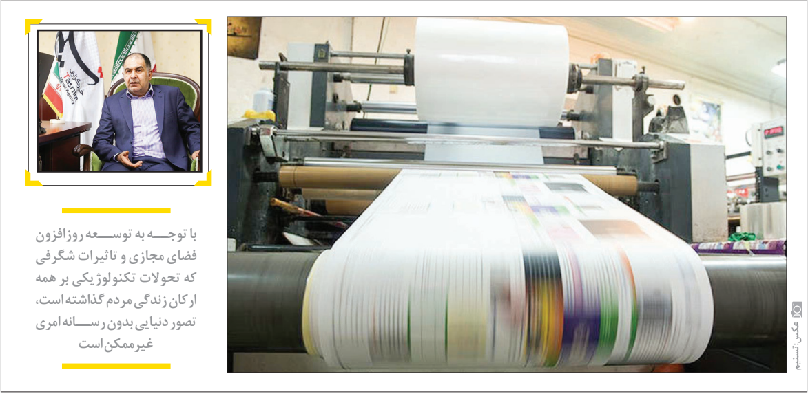
کارخانه کاغذسازی در استان خراسان رضوی

کروناست. در پیگیری خرید و توزیع کاغذارزان قیمت برای روزنامه‌ها که یقیناً به بهترین صورت ممکن به انجام خواهد رسید، همچنین پیگیری جدی معافیت مالیاتی رسانه‌ها، هر چه در توان داشتیم گذاشتیم که یاری رسانه‌ها را انجام دهیم، البته همه این‌ها جدای از خدماتی است که این معاونت به‌طور معمول به رسانه‌ها ارائه می‌کند.