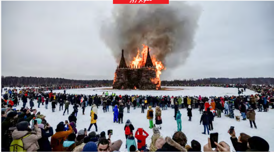
جشنواره سنتی «ماسلنتسا» در روسیه.

امام رضا (ع): هر کس یک روز از ماه شعبان را برای گرفتن ثواب خدازوره بگیرد، حتما به بهشت می رود و هر کس در هر روز از ماه شعبان، هفتاد بار از خدا آرزو می بخواند، روز قیامت، در گروه پیامبر خدا محشور می شود.