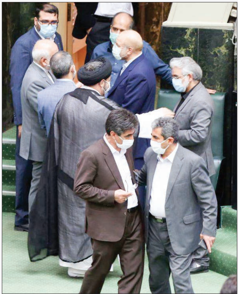
عروج فلاحی ملت

نخستین روز کاری مجلس شورای اسلامی با انتقاد شدید نمایندگان از محمدجواد ظریف به خاطر سخنانش در فایل صوتی منتشر شده از او همراه بود. ابتدا در جلسه غیر علنی مجلس این موضوع بررسی و تصمیم به تشکیل دو تیم تحقیق و تفحص برای بررسی انتشار این فایل از مرکز تحقیقات استراتژیک ریاست جمهوری و همچنین وزارت خارجه گرفته شد. البته قرار است این موضوع در کمیسیون امنیت ملی بررسی شود.