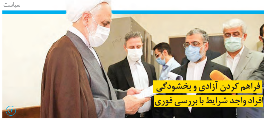
فراهم کردن آزادی و بخشودگی افراد واجد شرایط با بررسی فوری