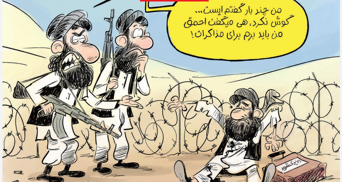
در خبرها آمده که طالبان در افغانستان همه مردم را تا اطلاع بعدی، ممنوع الخروج کرده است... موضوعی که سوژه کارتون از مهدی عزیزی در خبر آنلاین شد.