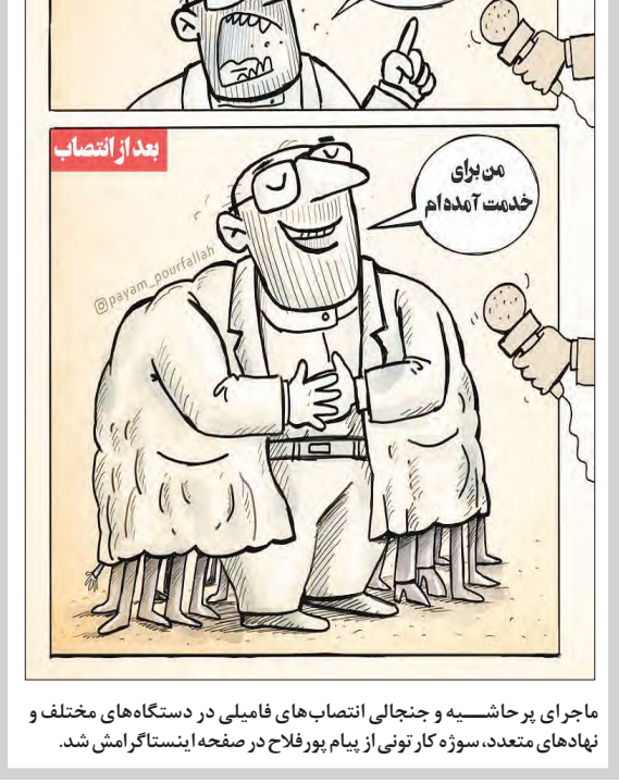
ماجرای بر حاشیه و جنجالی انتصاب های فامیلی در دستگاه های مختلف و نهادهای متعدد، سوززه کار تونی از پیام پورفلاح در صفحه اینستاگرامش شد.

امام حسن (ع) از دشمنی به شدت بر حذر باش. امام علی (ع): ای مردم! بدانید که دنیا سرای نیستی است و آخرت، سرای ماندگاری است. پس، از گذرگاه خود، برای اقامتگاهتان توشه برگزید.