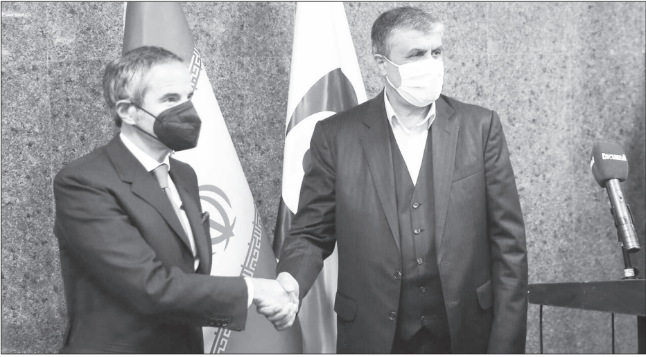
عباس عراقچی، وزیر امور خارجه ایران، با مدیرکل آژانس بین‌المللی انرژی اتمی، آلفرد اوسوالد، در جریان نشست مشترک در تهران.