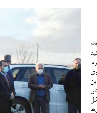
مدیرعامل شرکت آب و فاضلاب استان کرمانشاه خاطر نشان ساخت: به مدار آوردن این چاه به اقداماتی از جمله خرید